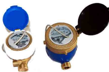
CD ONE TRP DS TRP