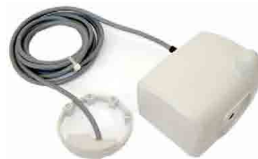
Versione con ARROW Dp (Telelettura)

Accessori: vite di serraggio e sigillo adesivo